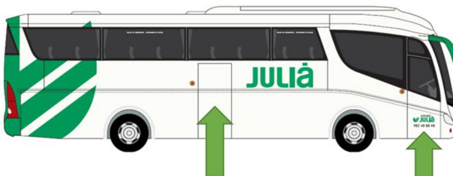
Mantener la distancia de seguridad recomendando 1,5m en los accesos al autocar